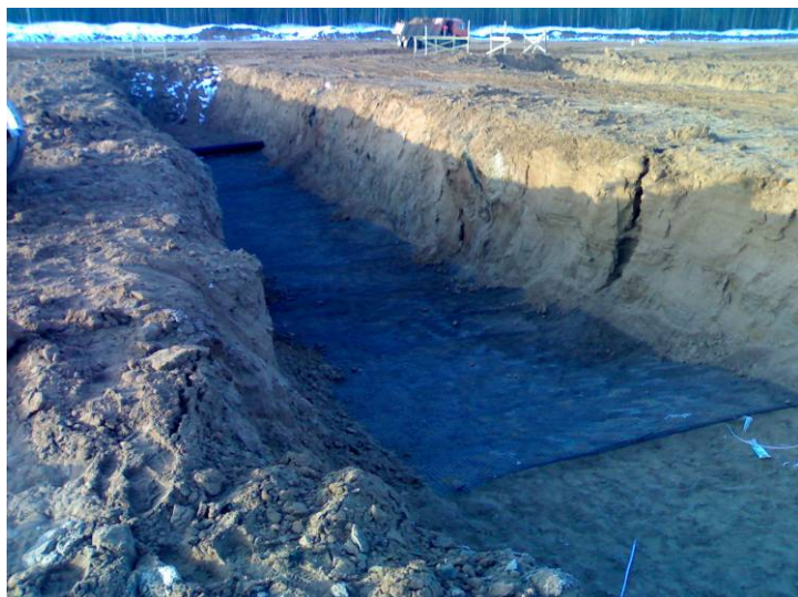
Укладка георешетки Тенсар