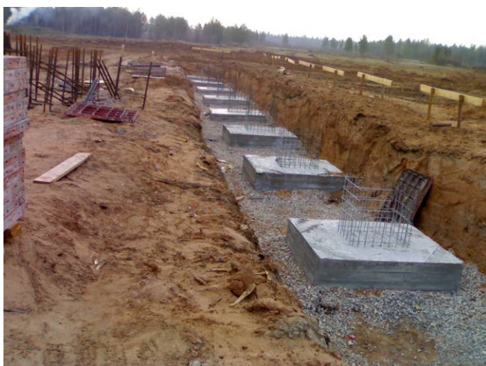
Поверх решетки укладывается щебень и устанавливаются отдельно стоящие фундаменты