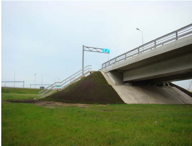
Пересечение Кольцевой автодороги и Западного Скоростного Диаметра